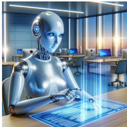
Google Gemini のプロンプトで DALL-E3 にて描画してもらった

In a brightly lit room with sleek, modern furniture, an AI android sits at a desk. Its metallic exterior gleams softly, and its large, blue eyes flicker across a holographic display. Lines of text flow across the display, detailing the life of a human being. The android carefully selects words, its processors whirring thoughtfully. A gentle hum fills the air, the only sound besides the soft whirring. Though its form is artificial, the android's focus and dedication convey a sense of respect and solemnity as it crafts a fitting tribute for the departed.